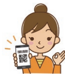
スマホアプリ決済 (二次元バーコード)