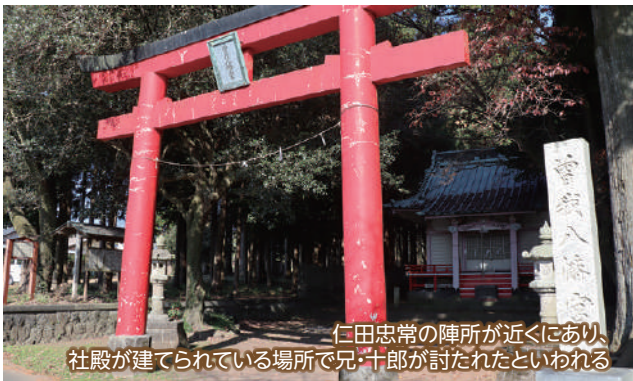
仁田忠常の陣所が近くにあり、社殿が建てられている場所で兄・十郎が討たれたといわれる

頼朝は、幼い時に父を亡くし、長年の苦難の末に父の仇を討った兄弟の姿に感心し、1197(建久8)年、畠山重忠を派遣して、地元の住人にここに兄弟を祀らせたといわれています。