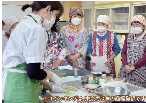
エコ・クッキングは、東京ガス(株)の商標登録です

市では、事業者の協力を得て、「エコ・クッキング講座」を開催しています。普段は捨ててしまう野菜の皮や茎、魚の頭を使って調理したり、汚れた調理器具を要らない布で拭きとってから洗うなど、「買い物・料理・食事・片付け」の過程で、食品ロスや電気・ガス・水などの使用量を減らす方法を学びます。