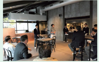
▲ Mt.Fuji Brewing にて

総務文教委員会では、富士山本宮浅間大社東側市有地整備事業の進捗状況について所管事務調査を行い、平成31年3月23日にオープンした、Mt.Fuji Brewingを視察。店舗内の様子や、300ℓの仕込み釜をもつビールプラント、厨房での調理の様子などを見学しました。その後、経営者にお話を聞かせていただき、厳選した富士宮市の食材をお客様に楽しんでいただきたいとのことでした。中心市街地の活性化の新たな可能性に期待したいものです。