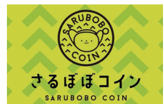
▲高山市、飛騨市等で使える、さるぼぼコイン