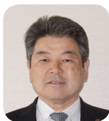
まつなが たかお 松永 孝男 議員 (富岳会)