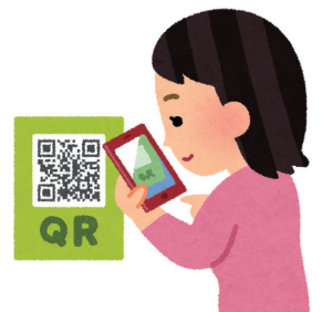
▲スマートフォンでのキャッシュレス決済

部長 市としてはキャッシュレス化に関する国の最新情報を入手し、情報提供することで市内のキャッシュレス化を図り、市民の日常生活がさらに便利となる社会の実現を目指していきたいと思っている。