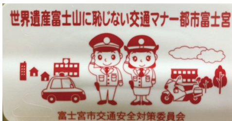
▲世界遺産富士山に恥じない交通マナー都市 富士宮

部長 平成30年と29年の対比で、増加率では県内でワーストワン。また、加害者の約7割が富士宮市民である。市スローガン「世界遺産富士山に恥じない交通マナー都市 富士宮」を掲げ、市民に交通安全啓発を行っていく。