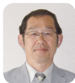
わたなべ よしまさ 渡辺 佳正 議員 (日本共産党議員団)