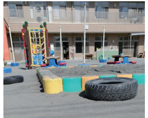
▲保育園では、急に体調を崩す子どもがいる。

部長 富山市で導入している例からすると、保護者が迎えに来ることができない場合、保護者にかわって看護師と保育士がタクシーで迎えに行き、かかりつけ医などを受診したあと、園の病児保育室で子どもを預かるというシステムであり、富士宮市としては、病児を預かる保健室が必要なため、まず、新しい児童館と、子育て支援センター開設後に予定している大宮保育園に病児保育室を開設し、必要に応じて研究をしていく。