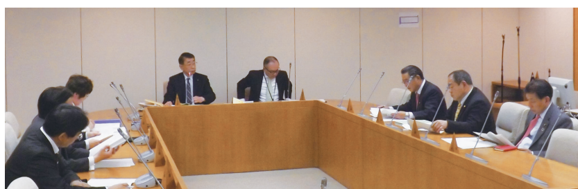
▲ ICT 利活用推進特別委員会の様子

タブレット端末等に係る禁止事項や遵守事項を定めた「富士宮市議会における貸与端末機の使用基準」も作成し、タブレット端末を、31 年 11 月定例会から運用することとしました。