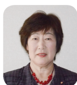
わかばやし しづこ 若林 志津子 議員 (日本共産党議員団)