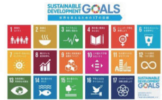
▲ SDGs 17の目標