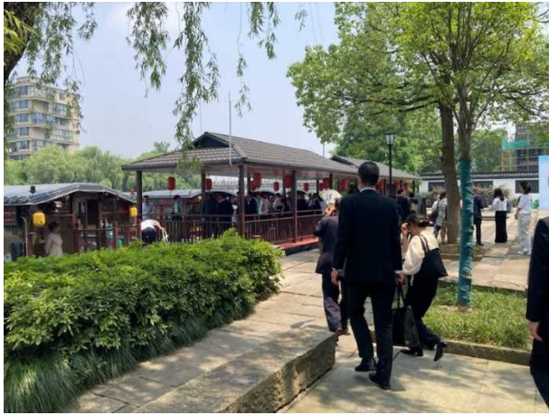
浙東大運河を船で移動