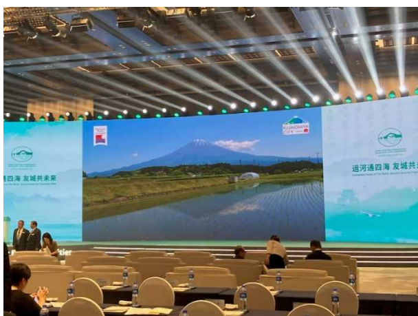
開場後、富士宮市の紹介動画が流れる