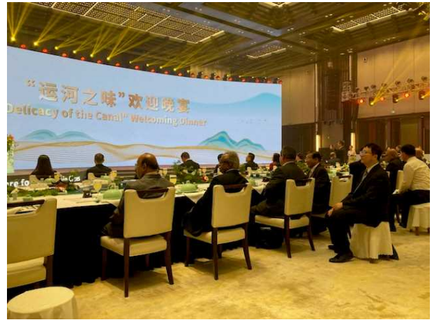
レセプション（歓迎夕食会）会場