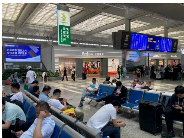
上海虹橋駅構内の様子