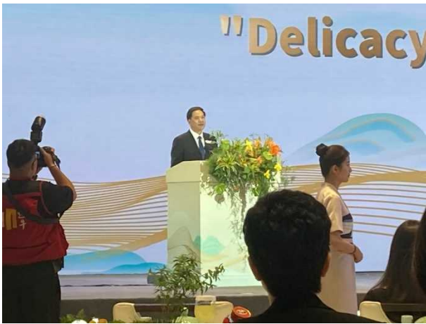
紹興市代表のあいさつ