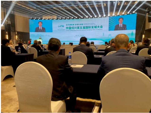
紹興市長のあいさつ