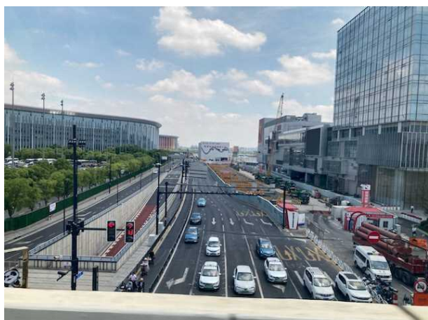
上海市内の様子（車窓から）