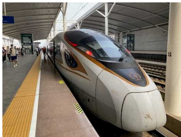
上海市～紹興市まで高速鉄道で移動