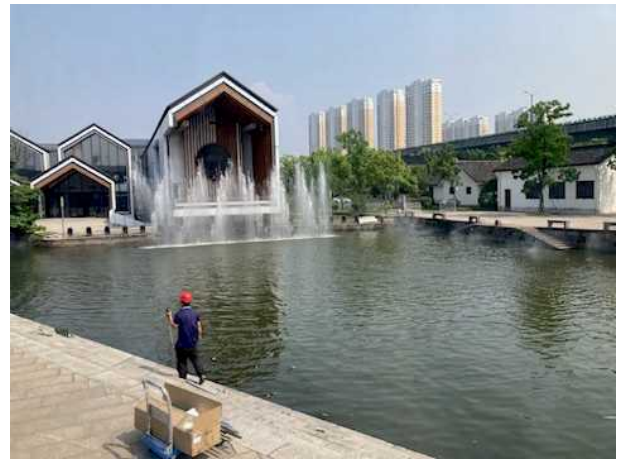
柯橋古鎮（カーニバル会場）