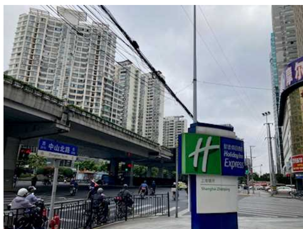
上海市内の宿泊ホテル前の様子