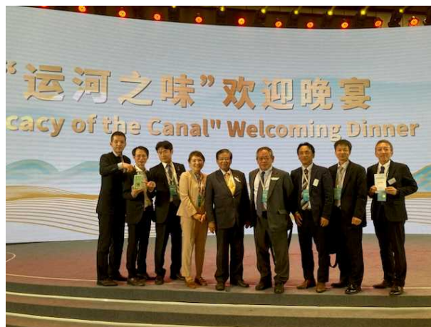
レセプション（歓迎夕食会）終了後、記念撮影