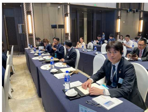
友好都市大会中は同時通訳で対応