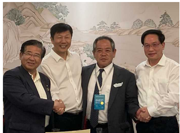
夕食会を主催していただいた朱副主任（右）