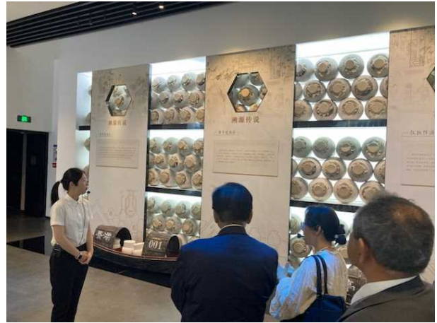
黄酒博物館を見学