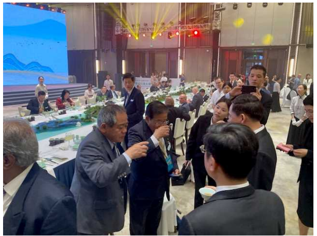
紹興市代表と乾杯