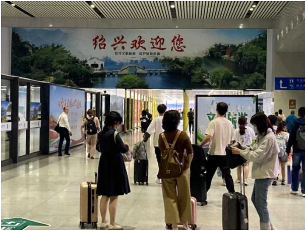
紹興北駅構内の様子