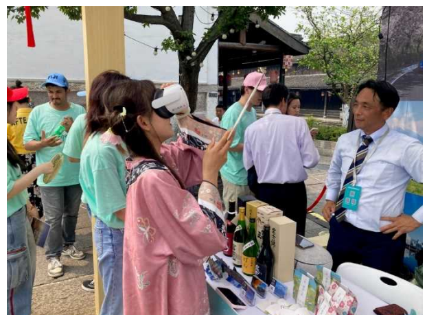
VR ゴーグルの動画で市の紹介