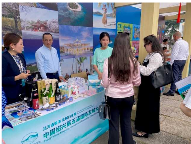
特産品を並べた展示ブース