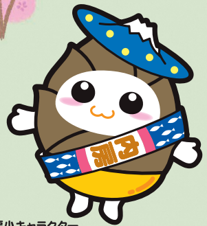
内房小キャラクター たけピカくん