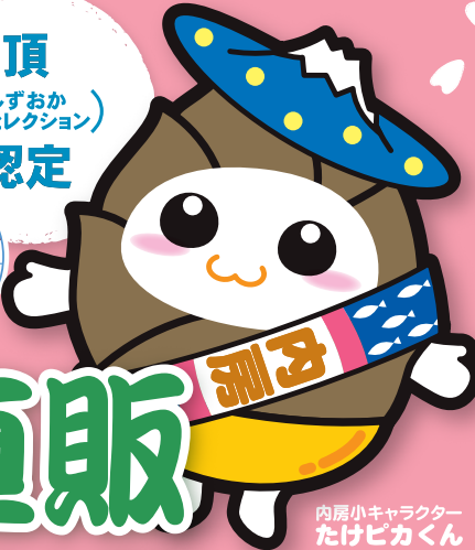
内房小キャラクター たけピカくん