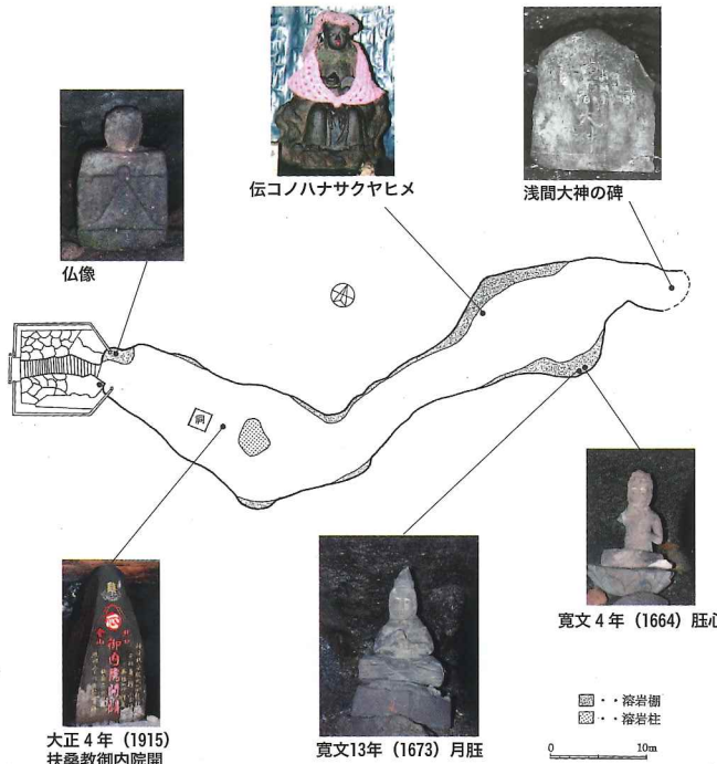
Hitoana Stone Carvings '히토아나'의 석조물 "人穴"의 石造物

是在约1万年前喷发的熔岩流中形成的83.3米、最高约为6米的洞穴。从入口进去，马上就能看到熔岩柱，最深处积有水和沙石。此外，内部还供奉有6座17世纪~20世纪初的石造物。