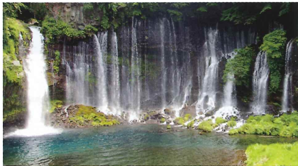
Shiraito no Taki Waterfalls (aerial view)

富士讲的人们攀登富士山，并遍历与开山祖师角行有渊源的湖泊、洞穴以及瀑布等。这些地方都是世界遗产的构成资产。