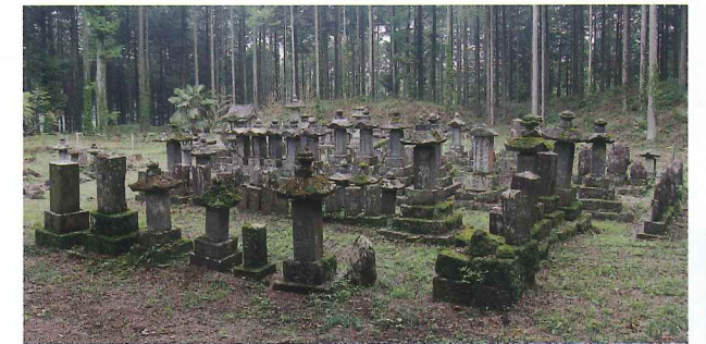
Stone Monuments Grouping 비석탑군 碑塔群

作为对先贤的供养和大愿实现纪念，富士讲的人们建立了约200座碑塔。碑塔上刻有讲的所在地、象征性标记以及成员名字等。这些碑塔大部分是由东京方面的富士讲所建立的。