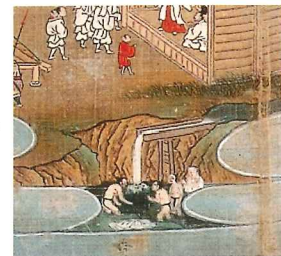
絹本著色富士曼荼羅図の村山部分拡大（富士山本宮浅間大社蔵）

村山には、今も水垢離場が残されている。水垢離場へは、社叢裏手の沢に湧く湧玉池の水を引き、上の段から樋で落とし垢離を取るようになっていた。水の落ち口には山伏修行の時の主尊とされる不動明王の石像が安置されている。村山の修験者が各地に富士垢離を広めたといわれ、今も伊勢や近江などに富士垢離の伝承を残している所がある。