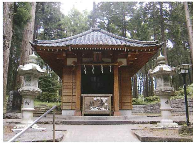
現在の高嶺総鎮守社

現在は高嶺総鎮守社と呼ばれ、元村山地区の氏神となっている。社殿は平成15年（2003）に再建された。