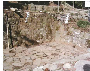
水垢離場（間口約6.5m×奥行約4m×深約0.6m）