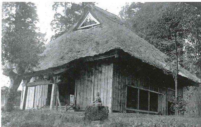
大正時代の大日堂全景

現在大日堂には、大日如来坐像2体（胎藏界1・金剛界1）・不動明王立像2体・役行者倚像1体と後鬼・前鬼のどちらか（破損が激しく像容がはっきりしない）1体が安置されている。