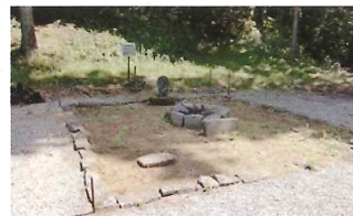
護摩壇（5.3m四方の石垣の中に直径1.4mの丸い石組）

現在の護摩壇は、安政4年（1857）にかつて境内にあった「大棟梁権現社」拜殿跡の上に造られたと考えられている。護摩壇正面には不動明王の石像が祀られている。