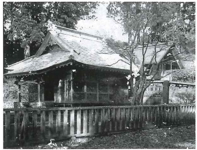
大正時代の村山浅間神社 （当時は浅間神社と大日堂を区切る柵があった）

神仏分離によって境内社富士浅間七社を相殿として造られ、中座 ちゅうざ に木花開耶姫 このはなさくやひめ 、左座 さざ に大山祇命 おほやまつのみこと ・彦火々出見命 ひこほでみのみこと ・瓊々杵命 にぎの 、右座 みぎざ に大日靈貴 あまの （天照大神カ）・伊弉諾尊 いざなぎのみこと ・伊弉冉尊 いざなみのみこと を祀っている。