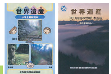
学校教育、生涯学習への活用（出前講座の開催、副読本の作成等）