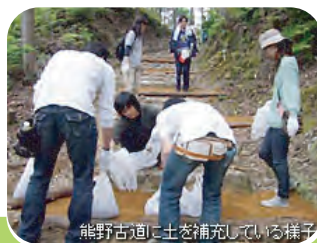
協働の保護体制づくり