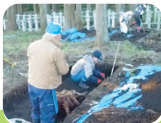
文化財の保存管理