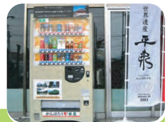
募金等の基金創設