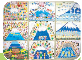
拠点となる施設の常設展示、公共施設や民間施設でのパネル展等による普及啓発