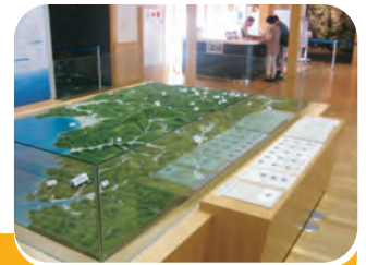
周遊拠点、サテライト施設を想定したアクセスルートの設定と施設整備