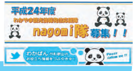
情報を連携して発信できるホームページの開設、SNSなど多様な媒体の活用