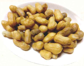
富士宮名物のゆで落花生