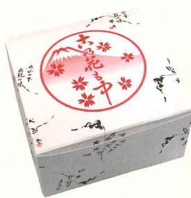
コノハナサクヤヒメをイメージした看板商品の最中

と桜をモチーフにしたお菓子を販売してきました。富士山本宮浅間大社に祀られているコノハナサクヤヒメをイメージした最中などが、祖父の代からの看板商品です。富士山の世界文化遺産登録を記念して作った羊羹やふやきせんべいも人気があります。