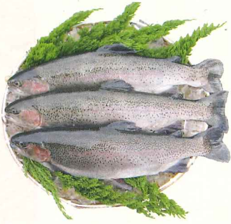
生産量日本一を誇る富士宮のニジマス

全国1位の生産量を誇る富士宮のニジマス。昭和初期に猪之頭地区で養殖が始まり、平成21年には、「市の魚」にも認定されました。豊富な湧水で育った富士宮のニジマスは、上品な風味と旨味が特徴で、複数のブランドが全国に出荷されています。