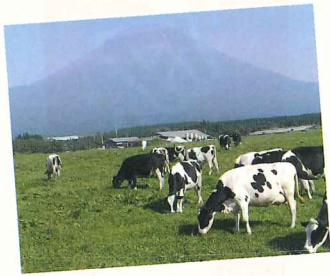
朝霧高原で放牧される乳牛

第二次世界大戦後に開拓が進んだ朝霧高原で営まれる酪農。生乳の生産量は県内全体の半分近く。南に向かって緩やかに傾斜する広大な牧草場が、牛たちをリラックサさせ、栄養ある牧草をはぐくみ、おいしい牛乳をつくり出します。