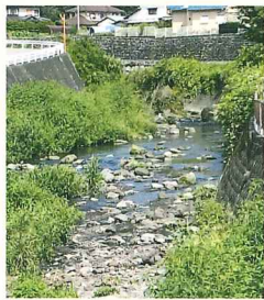
江戸時代まで神事が行われていた風祭川

富士宮市の風祭川では、室町時代から江戸時代にかけて、台風が襲来しやすいとされる9月1日頃の「二百十日」に神事が行われていました。川の中の10個の石を祭壇にして、風を鎮め、五穀豊穡を願う祈りを捧げていたのです。