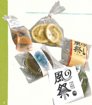
富士宮市内のお店などが企画した本年度の防災菓子「風祭」

富士宮高校会議所では、かつて防災にまつわる神事を地元で行なっていたことを思い出すために、地元のお店（まるじゅう、新月堂、もちのき、華月）や富岳館高校食品加工部と「風祭」という防災菓子を考案し、防災意識の向上に貢献しています。（澤田）