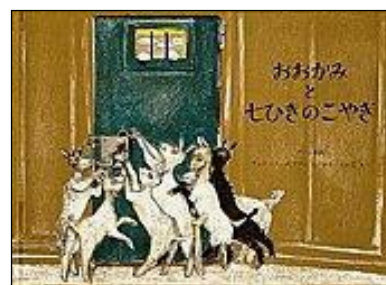
クラム童話 おおかみと七ひきのこやぎ