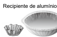
Recipiente de alumínio