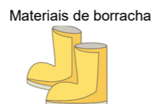
Materiais de borracha