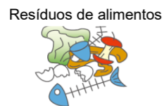
Resíduos de alimentos