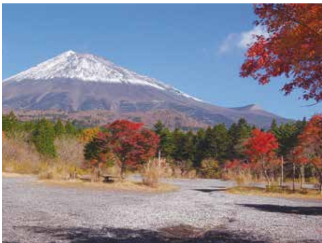
写真3-1 富士山南西面の植物の垂直分布 積雪の下方ラインが森林限界。