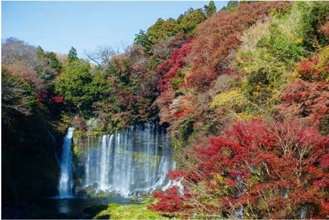
写真3-13 溶岩の壁から水が噴出している白糸の滝 照葉樹林と落葉樹林に囲まれている。