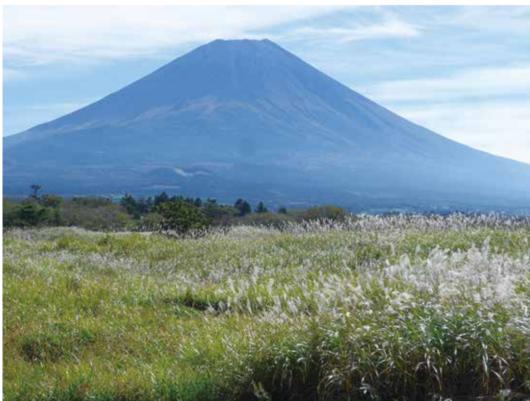
写真3-8 富士山西麓の広大な朝霧高原 牧草地と多様性の高い自然草原が混在している。

湿潤型草原にはタニソバ・タカトウダイ・アサマフウロ・ヌマトラノオ・クサレダマ・サワシロギク・ユウスゲ・ノハナシヨウブ・サワギボウシなどが出現する。