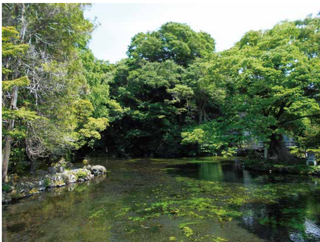
写真3-12 富士山本宮浅間大社境内の湧玉池 池は湧水を湛え四季を通じて水草を見ることができる。

白糸の滝から南に位置している狩宿の下馬桜は樹齢八〇〇年と推定されているヤマザクラの巨木である。国の特別天然記念物に指定されていて、日本五大桜の一つと言われている。源頼朝が馬をつないだ「駒止の桜」ともいわれ、花期には多くの富士宮市民が訪れ、憩いの場となっている。現在、度重なる台風などにより樹勢は衰退している（写真3-14）。