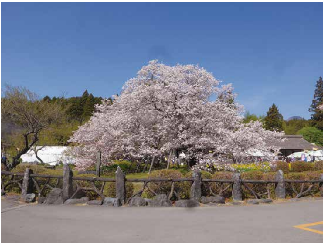
写真3-14 狩宿の下馬桜 樹齢800年と推定されているヤマザクラの巨木である。