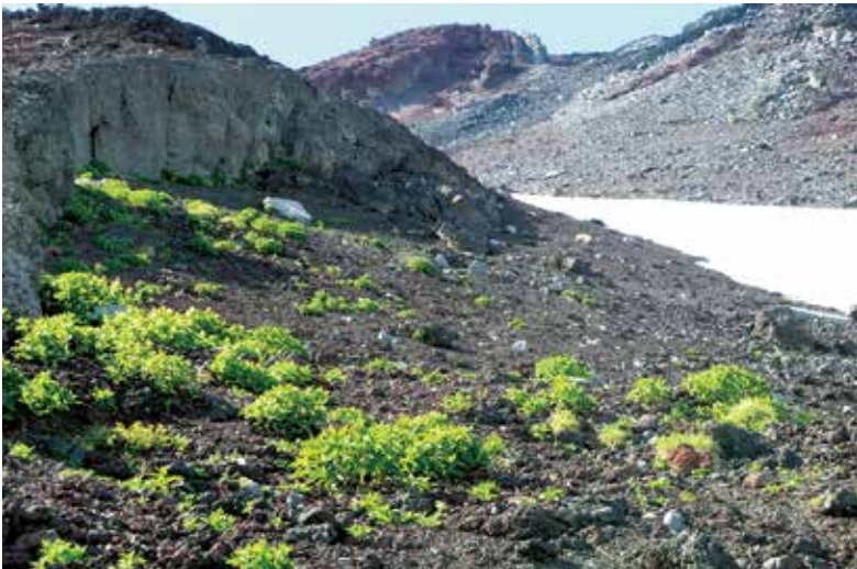
写真3-3 森林限界上部の草本植物群落 標高3,000mの砂礫地に点在するオンタデ。