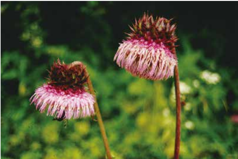
写真3-4 亜高山帯の砂礫地に分布する フジアザミ 大きな花をつけ、長い直根を持つ。