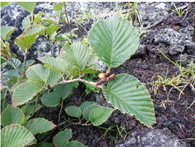
写真3-5 森林限界の先端部に生育する ミヤマハンノキ わい性低木で、葉の中に多量の窒素を含んでいる。