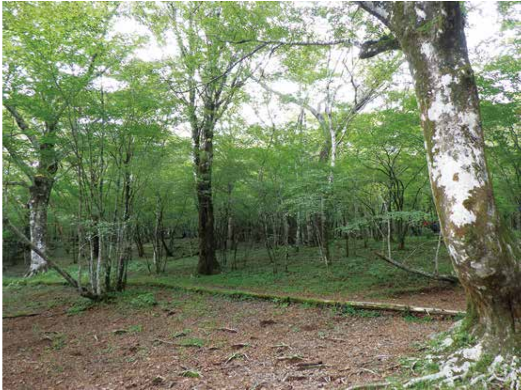
写真3-7 西白塚のブナ広場