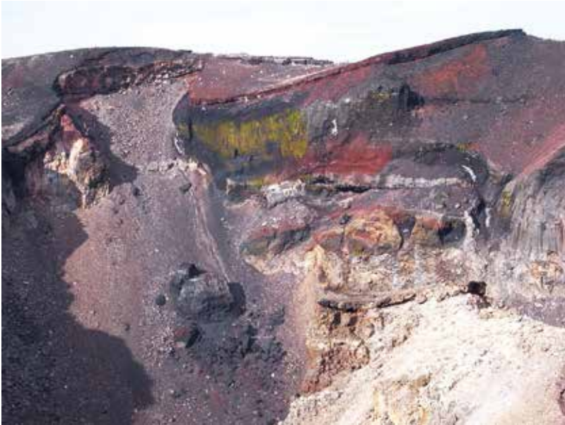
写真3-2 富士山山頂の火口