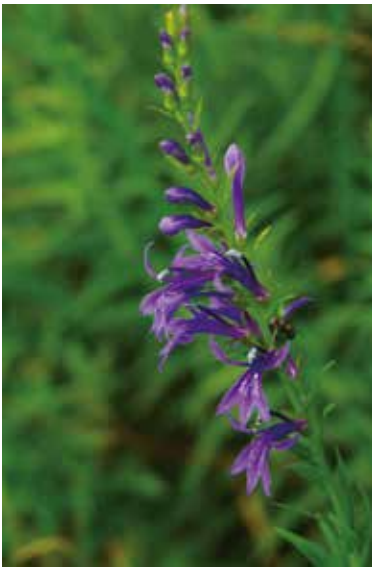
写真3-10 上：アサマフウロ 下：サワギキョウ