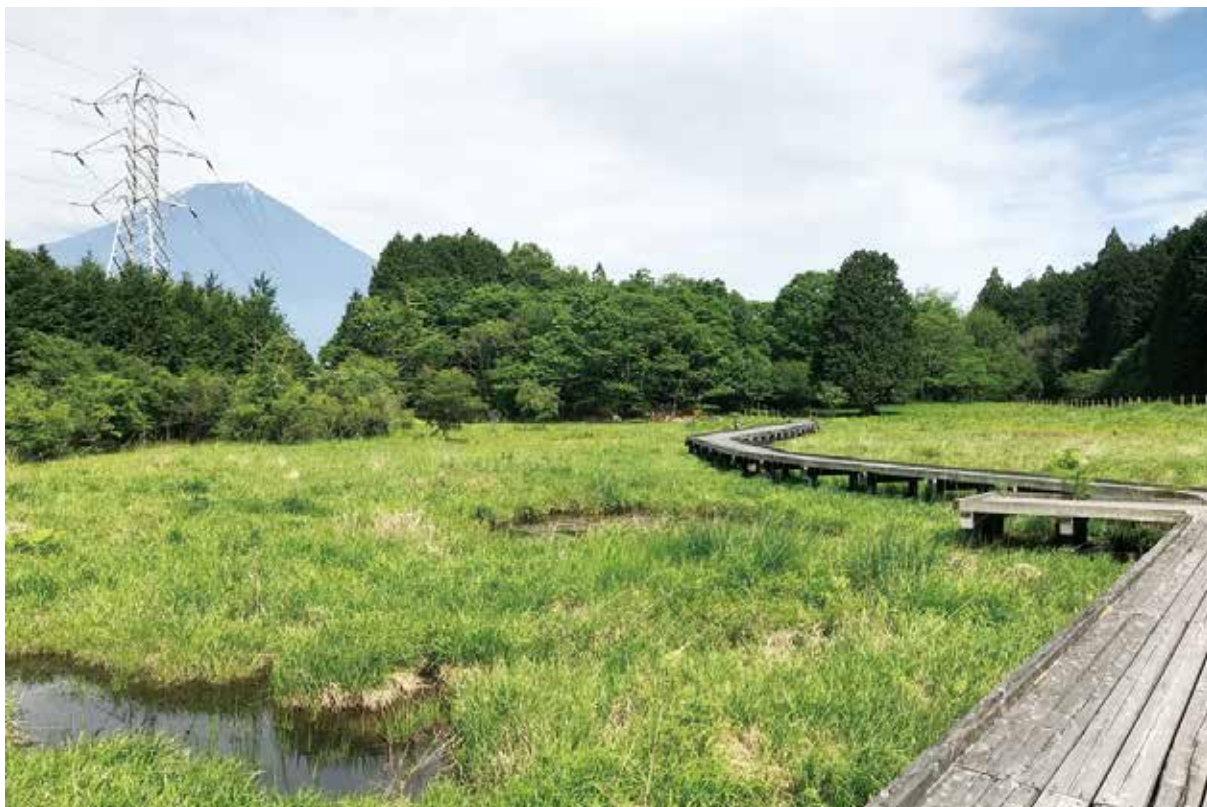
写真3-9 富士山西麓の唯一の湿原である小田貫湿原