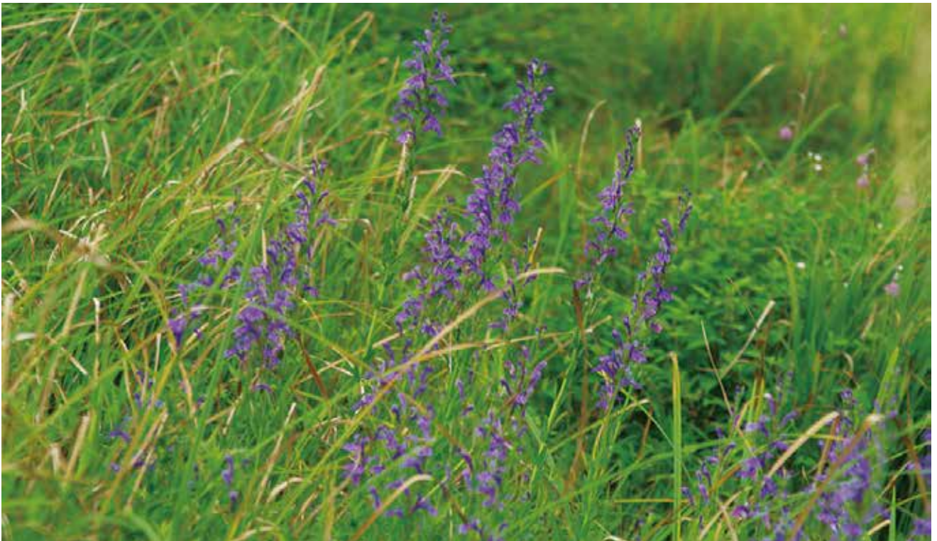
写真3-11 湿原の中の池の縁に生育するサワギキョウ アサマフウロとともに色鮮やかな紫色の花をつける。