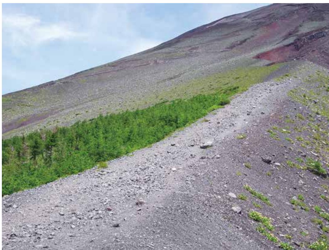
写真3-6 宝永第一火口付近の森林限界 近年森林限界線の上昇が見られる。

富士山の南および南西斜面の亜高山帯にはシラビソ・トウヒ・コメツガ・ウラジロモミといった常緑針葉樹が分布している。林床の草本類ではヒメノガリヤス・イチヤクソウの仲間が優占種となっていて、場所によっては林床がイワダレゴケ・タチハイゴケ・スギゴケに覆われている。ここは林内に蘚類群落が広く発達しているのが特徴である。この亜高山帯針葉樹林は標高一八〇〇m～二四〇〇m