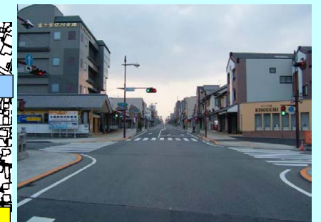
高質空間形成施設整備 (都)西富士宮駅大室坊線(神田通り)