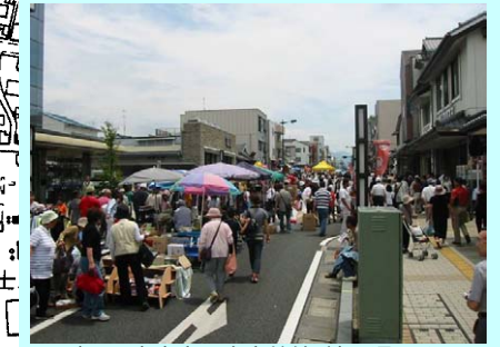
(都)西富士宮駅大室坊線(神田通り)を利用したフリーマーケット