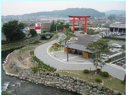
公園(神田川公園整備) 地域生活基盤施設(駐車場整備)