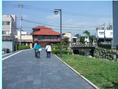
道路 一般市道宮町8・9号線(道路整備)