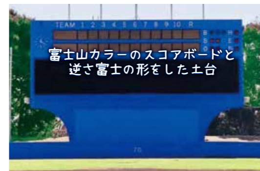
富士山カラーのスコアボードと逆さ富士の形をした土台