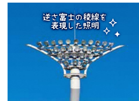
逆さ富士の稜線を表現した照明