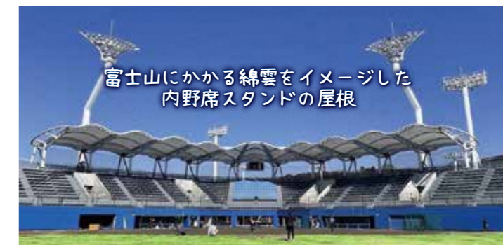
富士山にかかる綿雲をイメージした内野席スタンドの屋根