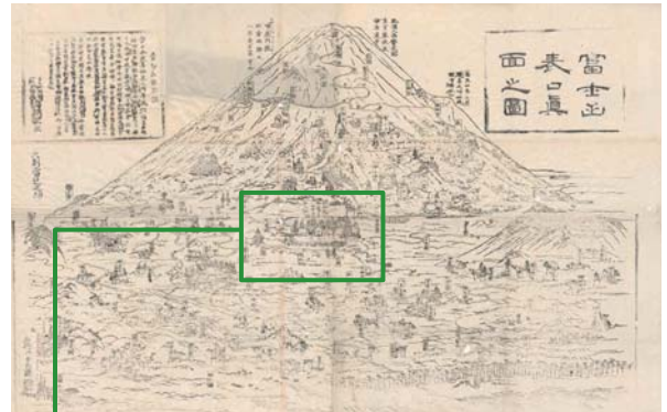
▲江戸時代後期、富士山の登山案内図として村山三坊から発行された「富士山表口真面之図」(静岡県富士山世界遺産センター蔵)