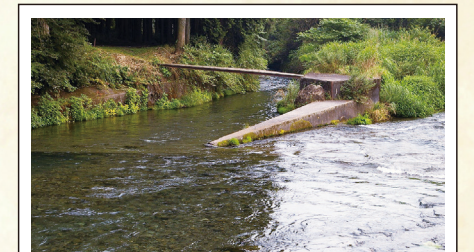
取水口 内野横手沢に設置され、その様子が江戸時代の北山用水経図にも描かれている。