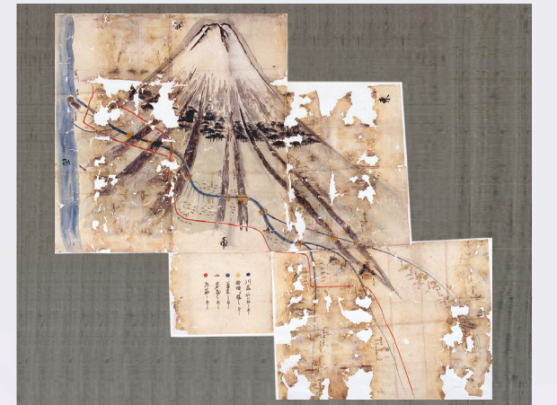
▲江戸時代の北山(本門寺)用水絵図

この北山(本門寺)用水は、江戸時代には、北山のほか、外神、宮原、山宮、万野原新田まで広げられ、生活に必要な水を確保しやすくなりました。