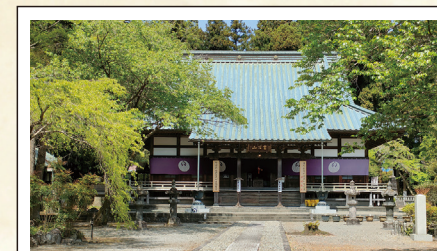
北山本門寺 甲州攻めの際、当時の買主*・日出が本尊を家康に貸したところ、鉄砲から守られたと伝わる(鉄砲曼荼羅)。*住職