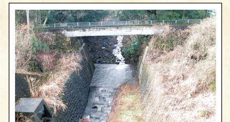
北山用水掛樋 大久保沢の深い谷の両側から、木製の樋を掛けて用水を通したとされる。