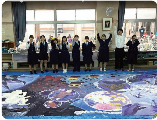
▲美術部部員のみなさん(表紙作品作成者)

私たち、富士宮西高美術部は、毎年クリスマスに近隣の障がい福祉施設「らぼ〜と」に絵画作品をプレゼントしています。コロナ禍でできる部活動のボランティア活動として始め、昨年で3回目となりました。