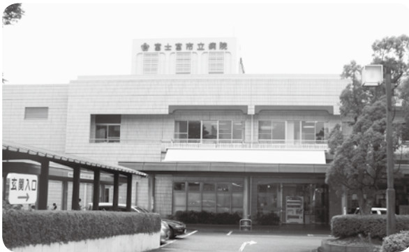
▲整形外科縮小の解消に取り組んでいる富士宮市立病院

病院長 当院の整形外科の医師はもう少し大規模な手術も考えているようだが、症例数は今の数を持続していきたいと思う。しかし、整形外科の医師数は1人。外来をやって、手術をやって、そこに救急患者が来ると、どこまで手が回るか現時点では何とも言えない。27年度は4月からの2カ月間で17件。6月12日までに25件の手術ができていくことから、1カ月に約10件の手術が対応できるように思う。これは、今の整形外科の医師が積極的に手術を施行してくれるからである。