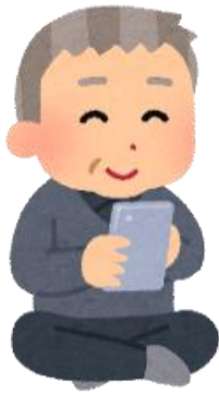
インターネット回答