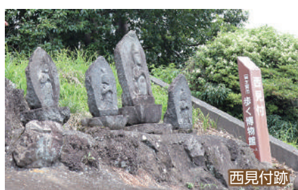
西見付跡・東見付跡

村山集落を管理した村山三坊(宿坊)の一つ大境坊は、主に村山修験の祖・末代上人を祀る大棟梁権現社を管理した。