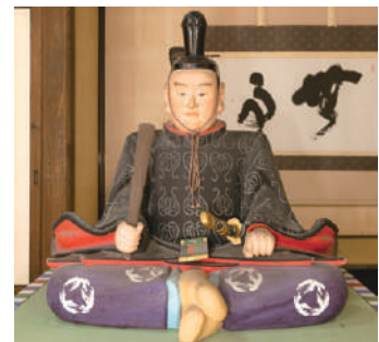
▲今川義元像(臨濟寺蔵)