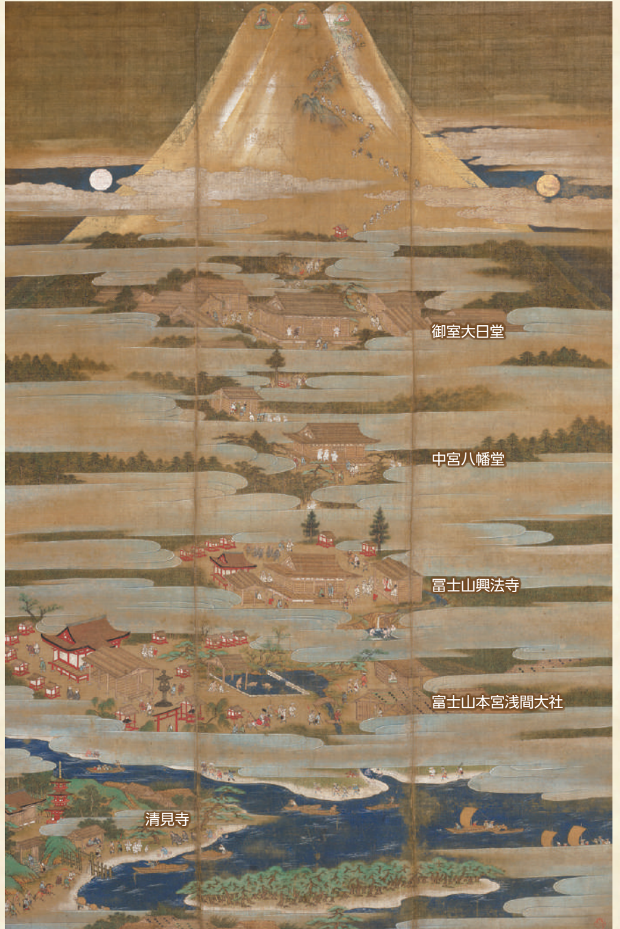
▲絹本着色「富士曼荼羅図」(国重要文化財・富士山本宮浅間大社蔵)