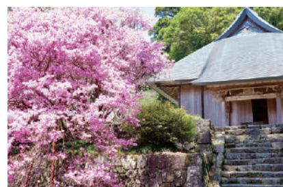
富士山興法寺(村山浅間神社・大日堂)

世界遺産富士山構成資産の一つ。数百年の間、富士山信仰の重要な拠点として、多くの修験者や登山者が訪れた。