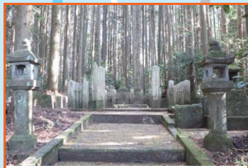
③ 曾我兄弟の霊地 曾我兄弟の兄(曾我十郎祐成)が、新田四郎忠常に討たれた場所といわれる