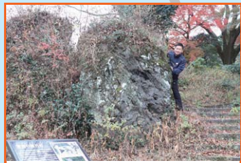
① 曾我の隠れ岩 曾我兄弟が身を潜め父を殺した工藤祐経の討ち入りを相談したといわれる