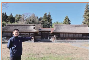
⑤ 井出家高麗門・長屋 この辺りに富士の巻狩で源頼朝が置いた宿があったといわれる