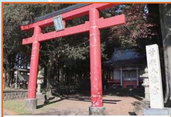
④ 曾我八幡宮 建久8(1197)年に源頼朝が曾我兄弟を祀らせたといわれる