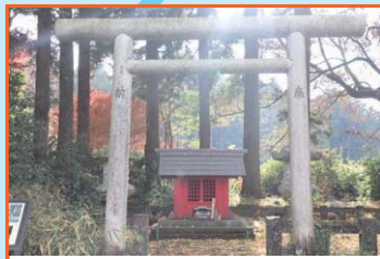
② 工藤祐経の墓 曾我兄弟に討たれた源頼朝の家来の墓