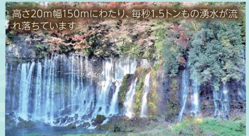
高さ20m幅150mにわたり、毎秒1.5トンもの湧水が流れ落ちています