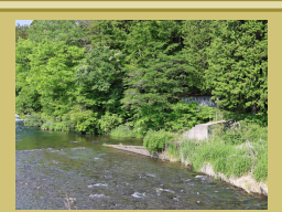
⑦北山用水取り入れ口