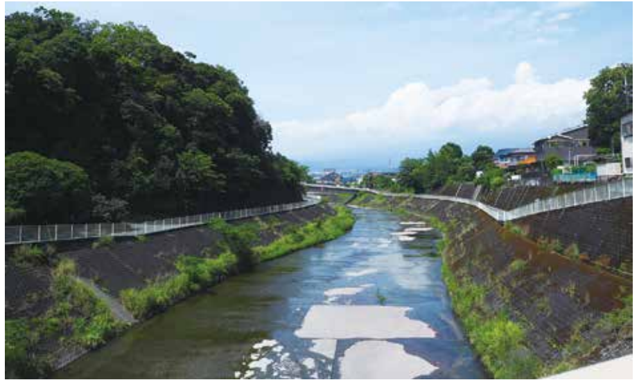
写真 1-1 星山放水路

また、大宮の弓沢町に欠畑という地名がある。浅間大社の案主富士氏が記した「公社日記」には、前述した天保の午流れによる洪水