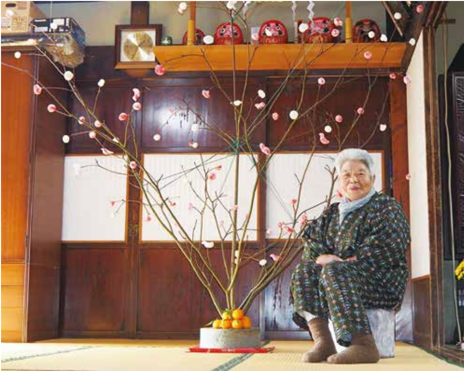
写真 1-4 繭玉（猪之頭）

女性たちの子安講にも、山梨県との深い関わりが見える。北山の峯組の子安講は、かつて集落の長男の嫁二〇人くらいが一月八日と一〇月一七日の年二回、当番の家に集まり掛軸の子安さんを押んで食事会をしていた。しかし、しだいに講員が減ったため、令和七年（二〇二五）一月五日をもって子安講の終い講を行った。この峯組の子安講の掛軸は市内のほかの子安講の掛軸とは異なり、「甲斐