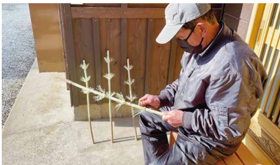
写真 1-3 ハナノキ（猪之頭）

馬の貸し借りの慣行は、「トオツパラ（遠原）三里」と呼ばれた朝霧高原の茅を秣（馬草）にしていた根原の地理環境にもよる。富士山麓では馬力や荷鞍を利用した駄賃稼ぎも盛んであった。遠原の茅原は、屋根茅や刈敷として利用されるだけではなく、甲府盆地の馬の飼料としても利用された。山梨県との往来は日常的に行われ、喜代晴氏の母親のように婚姻先として富士宮市内にやってくる女性