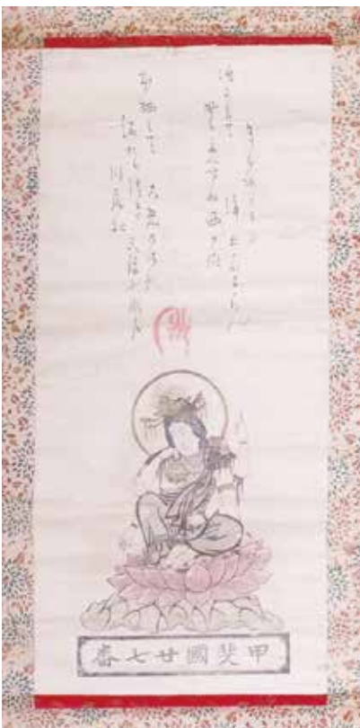
写真 1-5 子安講の掛軸 （北山峯組）

前述したように、市域でも山梨県境に近い北部では、大正から昭和初め生まれの女性の中には山梨県から嫁入りした人がいた。峰組の子安講の掛軸も、そのような女性が出身地の子安信仰を持ち込んできたものであろう。ちなみに、最も有名な杉田の子安さん（杉田子安神社）も川口村（山梨県南都留郡富士河口湖町）で湖に入水した「やす」の御霊を祀ったと伝えている。山梨県では、甲府盆地を中心とした国中と富士川流域の河内、富士五湖を中心とした南北都留郡の郡内、という大きく二つの民俗文化圏があると考えられている。中道往還に沿った市域の北部では国中・河内の子安信仰が、市域の東部では郡内の子安信仰が根付いたのである。同じ山梨県からの子安信仰の伝播でありながら、市内でも地域性が見られる興味深い事例だといえる。