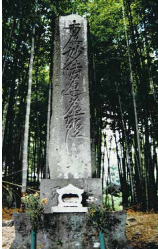
写真 2-1 長貫橋場の船中安全題目塔 (1994年撮影) ※現在はありません。

行うことが盛んに行われていた。石造物にもその痕跡があり、近世の資料に通じる貴重な民俗行事といえる（写真2-1）。