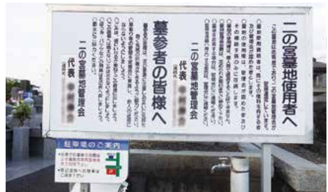
写真 1-16 二の宮墓地看板 市内の共同墓地には、このような管理組織が管理運営する看板が立てられている。