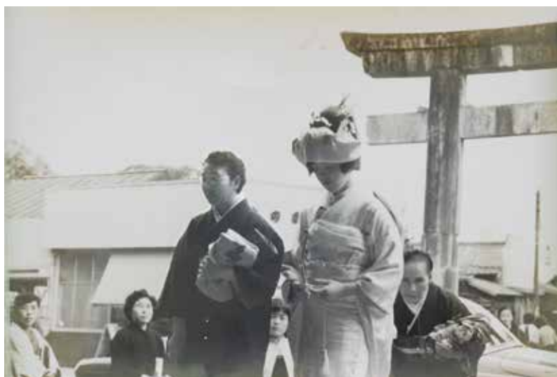
写真1-10 昭和30年頃の花嫁（宮参り）

洋筆筒・整理筆筒・布団・鏡台・張物板・足踏みミシンなどを持って行ったという。この行列には、後ろからソヨメ（添い嫁）という小学生の子どもがついてくる場合もある。花嫁が最初に嫁ぎ先の家に入る場所は、地域によって異なる。猪之頭の昭和九年生まれの女性によれば、嫁入りの当