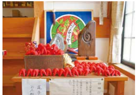
写真 1-2 ホウコサン

妊娠五カ月になると、腹帯を巻く。『芝川町誌』によれば、女性の取り親（鉄漿親）から七尺五寸三分（約二・二m）の祝い帯（岩田帯）が贈られるという。「妊婦の腹帯は戌の日に」といい、犬が多産で安産であることにあやかっつて安産であることを祈願し、また、子どもの健康、母体の安全を守るために巻いた。現在も腹帯は安産を祈願する神社などで販売されており、また、同様の目的で妊婦帯や産前ガードルなどが使用されている。