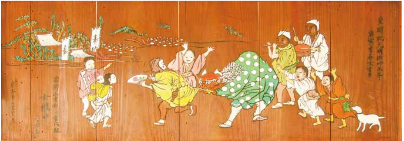
写真 1-1 杉田子安神社へのお参り（杉田子安神社蔵）