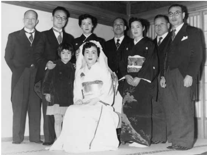
写真 1-12 婚礼衣装 着物とベール