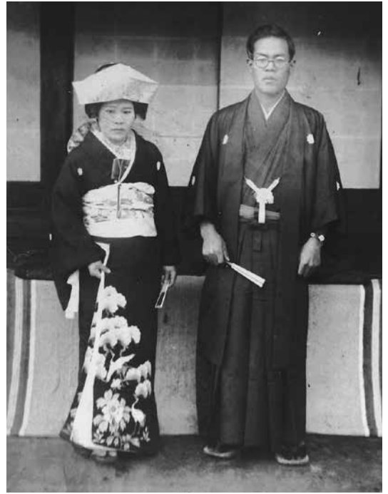
写真 1-11 婚礼衣装 江戸妻と角隠し (昭和初期内房、個人蔵)