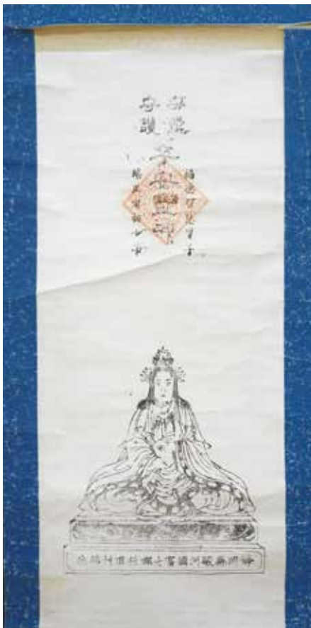
写真 1-9 子安講の掛軸 下条出口で用いられたもの。