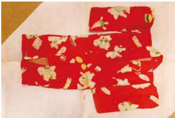
写真 1-3 願果たしの着物（自證寺蔵）