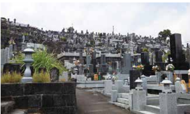
写真 1-19 野中の大泉寺墓地