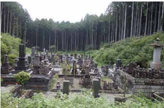
写真 1-20 半野区の共同墓地

このような屋敷墓から共同墓地への埋葬は、明治政府が明治五年（一八七二）から規制を始め、同一七年に「墓地及埋葬取締規則」を出したことに起因する。屋敷墓に埋葬することが禁じられ、墓地と火葬場は官庁の許可した区域に限られた。さらに、土葬から火葬へと加速したのは、第二次世界大戦後である。昭和三年（一九四八）に「墓地、埋葬等に関する法律」（墓埋法）が定められ、火葬は火葬場の施設で行うことが義務づけられ、施設の経営や変更は都道府県知事の許可が必要となった。富士宮市域でも火葬後は寺の墓地か地区の共同墓地の墓に納骨される。墓には骨壺を入れるためのカレットと呼ばれる納骨堂が設けられ、そこに代々の骨壺が並べられている。