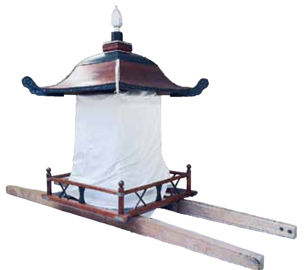
写真 1-15 棺桶を載せる輿と天蓋（内房大晦日） （注意）撮影のために輿に白布を仮設した。実際は、白布の箇所には座棺の棺桶が載せられる。

長貫の渡邊家では、令和四年（二〇二二）に新盆を迎えた。新盆では例年の棚とは別に、特別の棚を座敷に設える。亡くなったのは当主の母親であったので、その子どもたちが提灯や花などを贈ってくる。新盆の棚は七月末日までに作り、墓参りは八月一日に済ませた。このとき当家の墓だけではなく、本家や両親の実家、両親の兄弟などの家の墓にもお参りに行った。墓参りには香花と盆花のオミナエシを持っていき、小型の塔婆も立ててくる。八月一三日夕方、迎え火を門口で焚き、一六日朝にも送り火を門口で焚く。葬儀社で