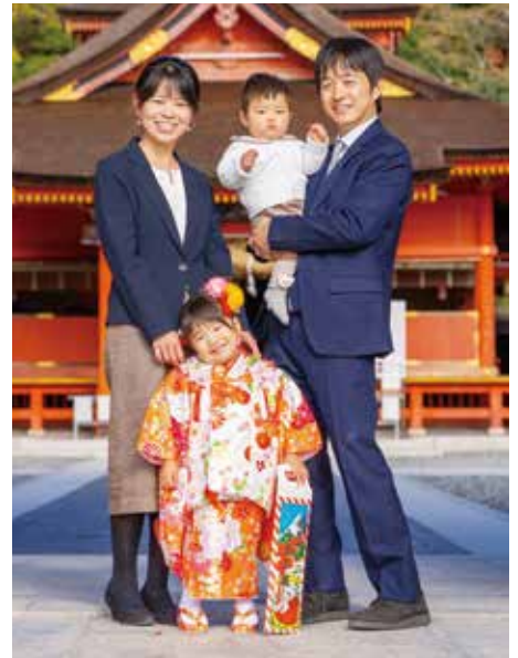
写真 1-7 浅間大社へのお参り（七五三）

子育て中や子育てを終わった嫁たちが集まり、家族から解放されて一晩「食い講」をするのが子安講である。食い講とは、同じ集団の講の人々が飲食を共にすることで親交を深め、また、神様とも共に飲食をする集まりである。子安講は、下条や猪之頭 いのかしら をはじめとして各地にある。子安講では、杉田の子安神社の掛軸や鬼子母神の姿が描かれた掛軸を掛け、若い嫁たちが集まって子授け・安産・無事な子育てなどを祈った（写真1-8・9）。また、子授け・安産を祈る子安講は、地域の子育てサロンとしても機能していて、年配者に育児を含めた困りごとを相談する場所でもあった。