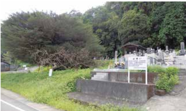
写真 1-18 山本区石の宮墓地 石之宮神社西側斜面に整備されている。

野中には、日蓮宗妙覚山大泉寺という寺がある。かつて万野原に建立された寺だったが、二度の移転後、万治元年（一六五八）に現在の野中に建立された。大泉寺墓地は市内最大のものとして、当寺