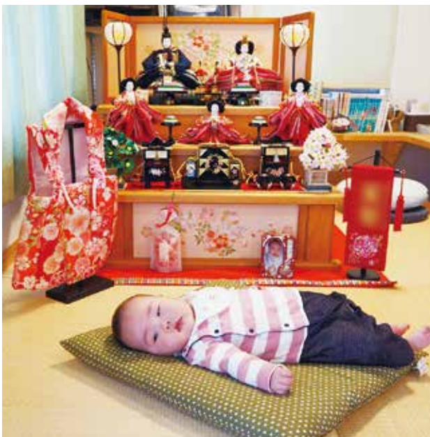
写真 1-6 初節供