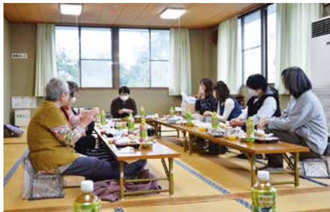
写真 1-8 子安講の様子（下条出口）