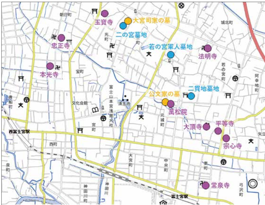
図1-2 富士宮のまちなちの主な墓地の位置図（地理院地図 Vector を加工して作成）

昭和五年（一九三〇）に刊行された『大宮町誌』によれば、明治二五年の町有墓地は大宮字二貫地と西大宮字十一通の二カ所、旧宝積寺そのほか廃寺に残る墳墓はすべて新設墓地へ移転改葬するところである。法令上、廃寺の墓地に埋葬することができなくなったからである。これらの共同墓地は、個人所有の土地を買取り、手狭になるとさらに買い取って増設していった。現在の二の宮墓地は、「二の宮