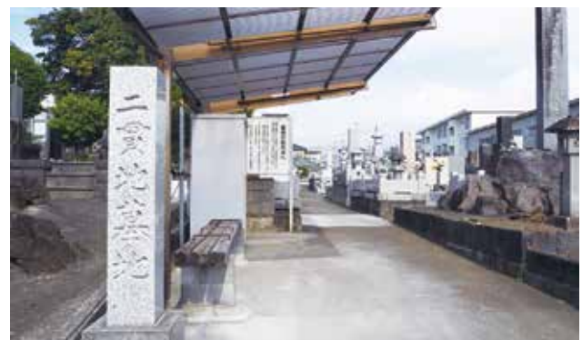
写真 1-17 二貫地墓地