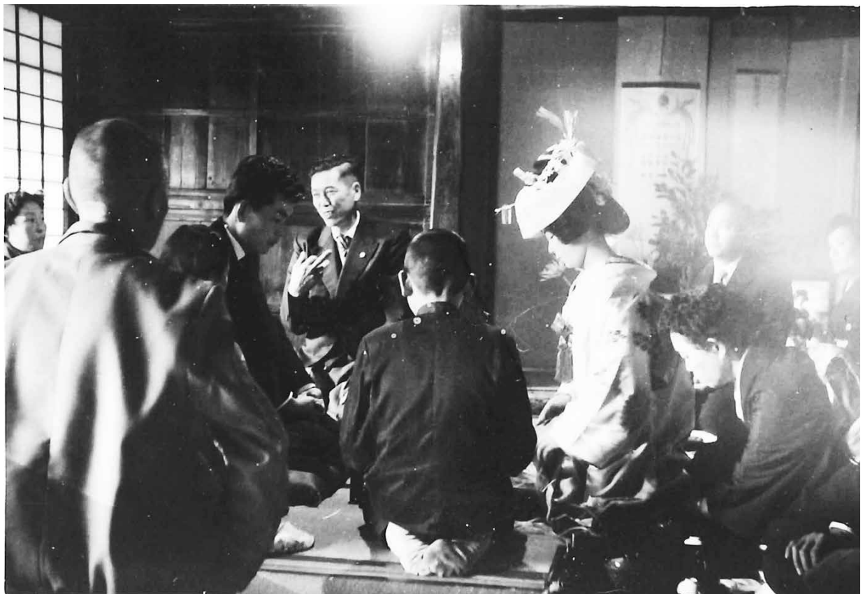
写真 1-13 三々九度 (昭和 35 年内房、個人蔵)