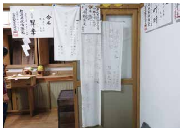
写真 1-5 命名の奉納布（根原の浅間神社）