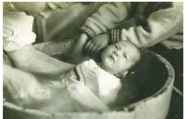
写真 1-4 産湯

子どもが生まれて初めて迎える節供は、女兒が四月三日、男児が五月五日に行く。女兒はひな人形が嫁の実家から贈られ（写真1-6）、両家 なうど の仲人、カネオヤ（鉄漿親）、叔父叔母や夫の兄弟などの親戚からは汐汲 しおく み人形などのケース飾りが贈られた。男児は鯉 こい のぼりや節供人形などが嫁の実家などから女兒同様に贈られる。鯉 こい のぼりとともに揚げるのぼり旗には、染物屋に頼むなどして家紋を入れた。この祝いをもたらした家には、赤飯とお返し お返し の品を届けた。