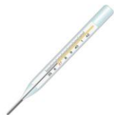
水銀体温計 水銀温度計