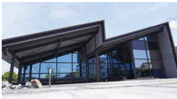
▲「Café & Restaurant DADA PLUS」外観

浅間大社東側市有地に新たにオープンした「Café & Restaurant DADA PLUS」は、富士宮産の野菜や地酒、富士山の伏流水でゆで上げられた生パスタなどが楽しめるレストランです。