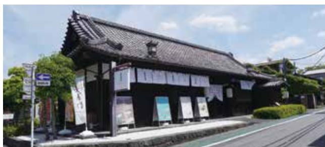
▲武家屋敷の雰囲気の色濃く残す長屋門

浅間大社東側に令和4年2月にオープンしたたこまん長屋門は、富士宮産の食材を使ったランチなどの食事や、県内の素材を使ったお菓子を販売しているお店です。