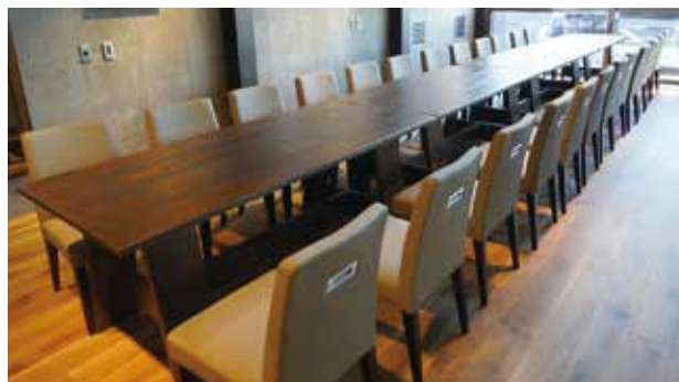
▲最大で24人が利用できるパーティールーム