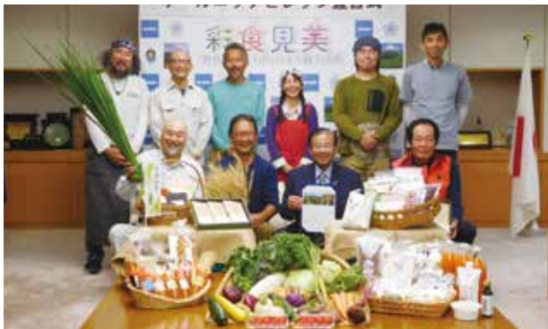
▲有機野菜生産農家も参加して行われた宣言式

公立小中学校児童・生徒全員へ有機茶のティーバッグを配布し、公立保育園の給食に有機野菜を使用するなど、有機野菜の消費拡大を行っています。また、農家向けの講習会を行い、新たな知識・技術の習得をサポートしています。