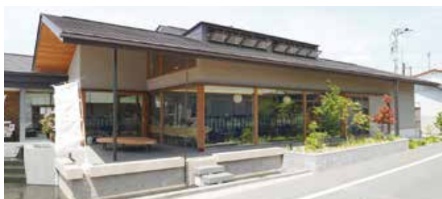
▲広いガラス窓が目を引く店舗外観

浅間大社西側市有地に令和6年9月20日にリニューアルオープンした江戸屋本店は、焼き立てのパンが味わえるほか、併設されたカフェでゆっくりと過ごすことができる店舗です。