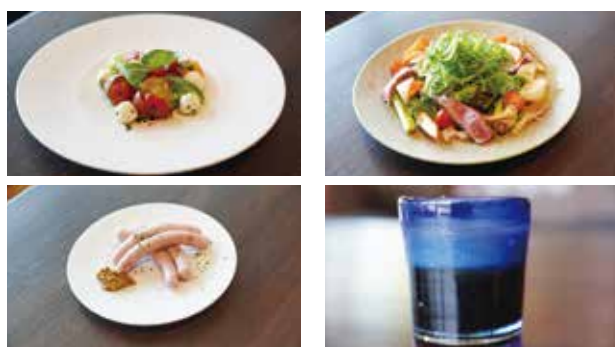
▲富士宮産の食材を使用したメニューの一部