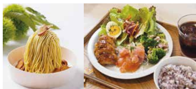
▲充実したメニューで皆さんをおもてなし