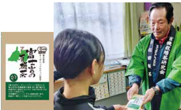
▲有機茶ティーバッグ(左)を贈呈