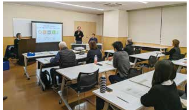
▲先進農家を招いての講習会