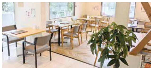
▲落ち着いて過ごせる食事スペース