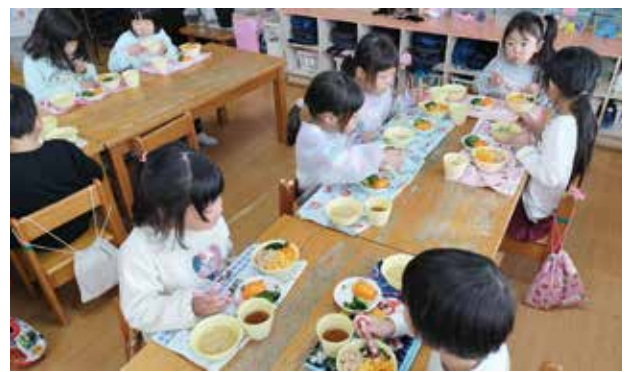
▲保育園の給食に有機野菜のメニューを提供