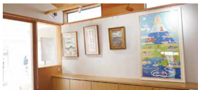
▲併設ギャラリーで絵画も楽しめます