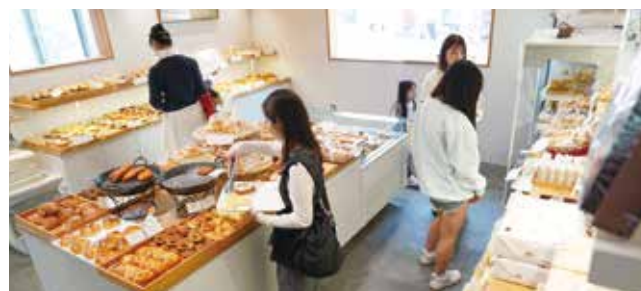
▲焼き立てのパンをじっくりと選べます