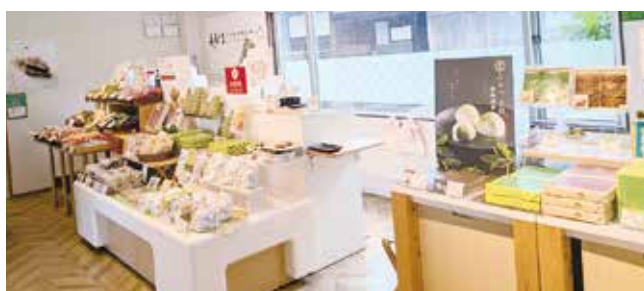
▲買い物スペースには季節の和洋菓子が並びます