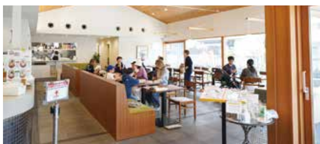
▲明るく、開放的な空間が広がる店内