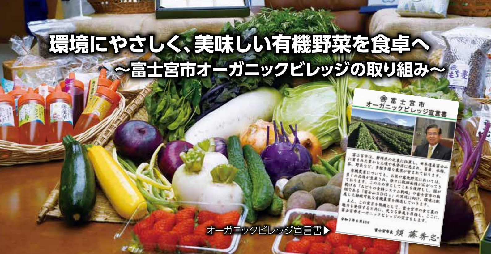
オーガニックビレッジ宣言書▶

市では、化学肥料や農薬に頼らず、たい肥などの自然由来の肥料で生産する有機野菜の消費拡大に取り組んでいます。令和7年6月13日にオーガニックビレッジ宣言を行い、農地(ほ場)の集約などの生産から消費までの一貫した取り組みを、農業者や市民などの関係者が地域ぐるみで行い、有機野菜の産地づくりを推進しています。