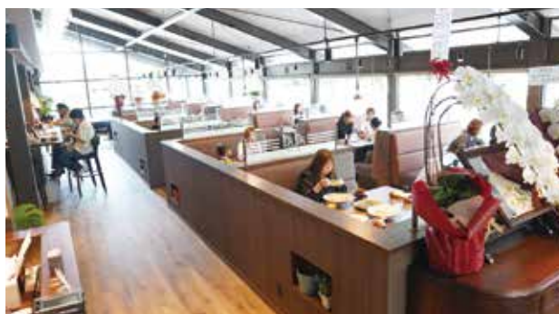
▲多くの人でにぎわう店内