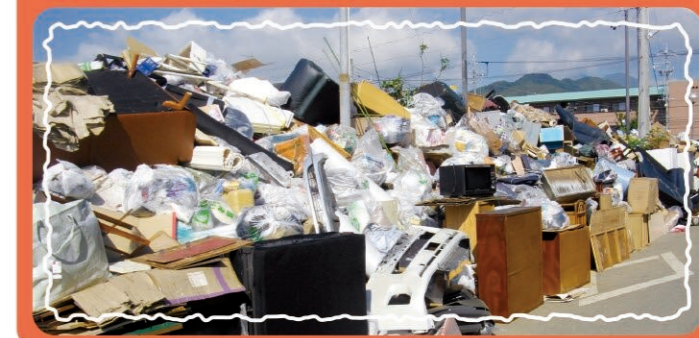
引用：静岡市清水区(令和4年台風15号被災時)