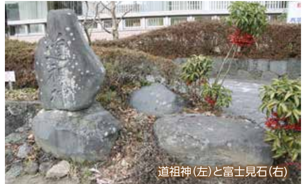
道祖神(左)と富士見石(右)