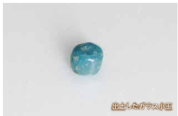
出土したガラス小玉