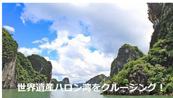
世界遺産ハロン湾をクルージング！