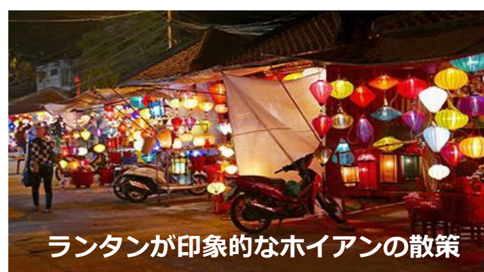
ランタンが印象的なホイアンの散策