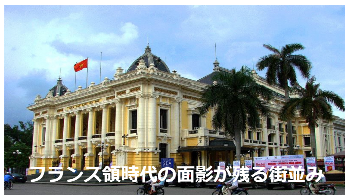
フランス領時代の面影が残る街並み