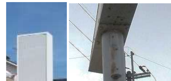
↑看板本体からポールへの汚ダレがあると、接合部にサビや腐食が進行する恐れ。