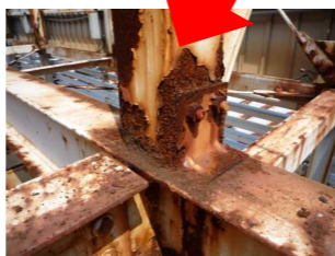
↑内部鉄骨のサビ・腐食。