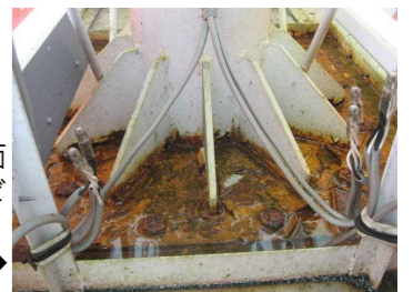
看板の根元がカバーで覆われている場合、表面はきれいでも内部でサビが進行している恐れも。