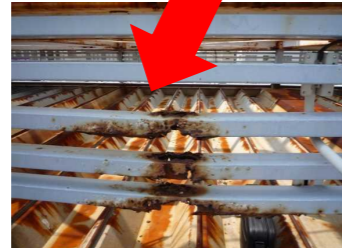
↑目隠しルーバーのサビ・腐食。