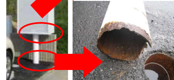
↑柱根元のサビを放置し、倒壊。

倒壊・落下の危険を見つけたら! ◆付近を立入禁止にし、見張りを置く。 ◆信頼できる屋外広告業者に連絡。 ◆人通りの多い場所では警察にも連絡。