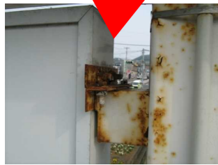
←取付金具のサビや腐食。ボルトやビス等が欠落していたら緊急の対応が必要。放置すると看板が落下する恐れも。