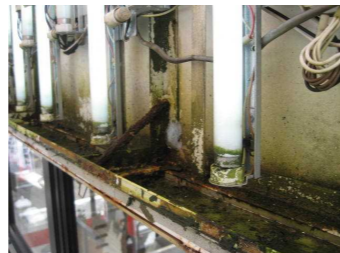
↑内照式看板内部の腐食、部材の腐食器具の劣化による出火の恐れも。