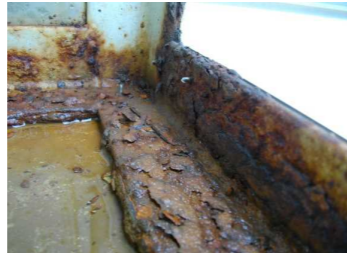
↑看板面(アクリル板)のひび、割れ、ゆがみ板面の落下により、内部に水が入り腐食する原因に。