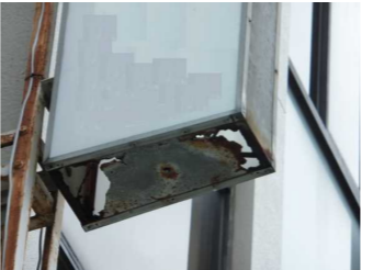
↑看板底部の留め具が壊れるとアクリル板が抜け落ちる原因にも。