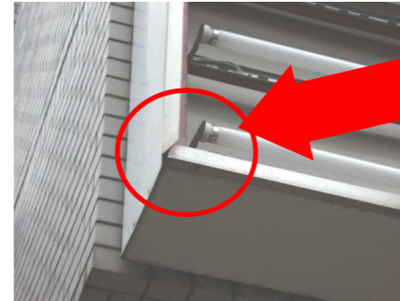
←パネルの変形、ズレ、破損の他、パネルの押さえ枠が変形し落下する場合も。

表示パネルの四方を押さえ枠で固定する欄間看板。複数枚のパネルを使用する場合は、隣り合うパネル同士をきちんと固定しないと、振動や風などで落下する恐れがあります。