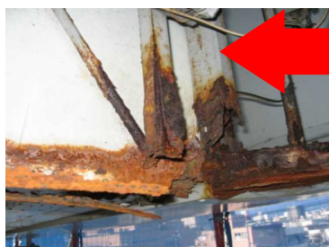
↑板面裏側のサビ、腐食。サビによる腐食はミルフィーユ状に剥がれ崩落する恐れも。