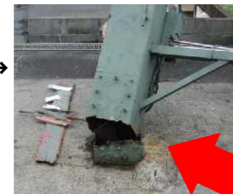
折れた柱の根元。点検口のボルト穴からサビが入り腐食して、鉄骨が破断した。

交通の激しい沿道で看板の柱が折れたが、隣地の看板が支えとなり、道路への倒壊を免れた事故。電線を切断すると停電による損害賠償額は膨大な金額になることも。