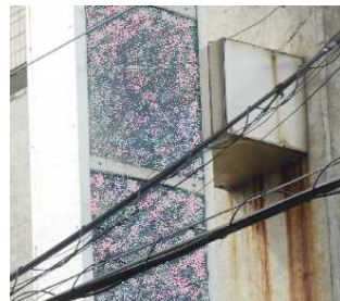
←ブラケット下に汚ダレが見られると、内部の取付金具にサビや腐食の可能性もある。