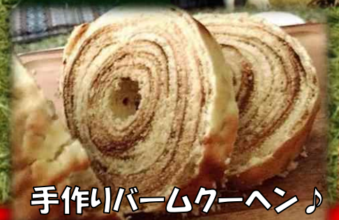
手作りバームクーヘン♪