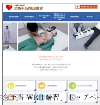
「応急手当 WEB 講習」トップページ

https://www.fdma.go.jp/relocation/kyukyukikaku/oukyu/