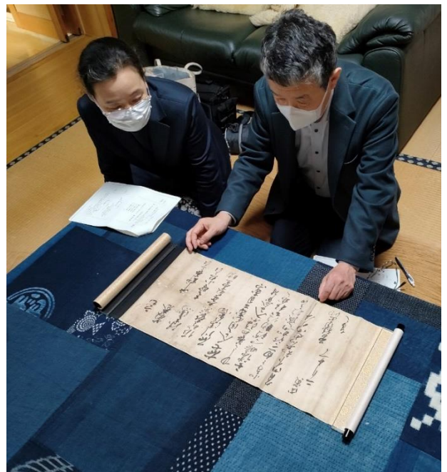
「武田家朱印状」調査の様子