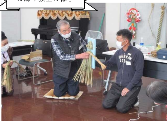
お飾り教室の様子