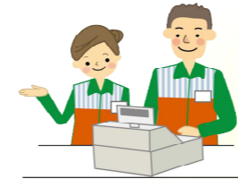
ご近所のお店屋さん