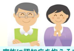
家族に認知症を抱える方