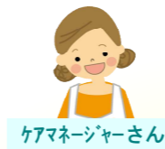
ケアマネージャーさん

富士宮市(平成28年)保護件数：187件(精神・自殺企図・酔っ払い等含) うち65歳以上で認知症が確認できた者 62件