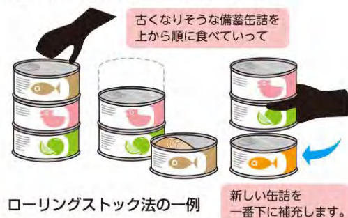
ローリングストック法の一例

日常生活で使用する食材やレトルト食品を、備蓄品の中から消費し、その都度買い足す事で備蓄品を新しい状態で保つ事をローリングストック法といいます。日常的に防災用品をチェックする事もできます。