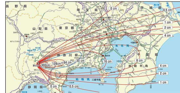
宝永噴火による影響範囲

噴火による降灰は、農作物への被害、人体への悪影響、交通機関の麻痺など、社会生活に深刻な影響を及ぼします。また、影響範囲も非常に広域で、長期間にわたって被害が続く事もあります。1707年(宝永4年)の宝永噴火の際は、偏西風の影響により、現在の富士宮市域にはほとんど降灰がありませんでしたが、偏西風の弱い季節に大規模な噴火がおきると、富士宮市にも降灰が発生する可能性があります。