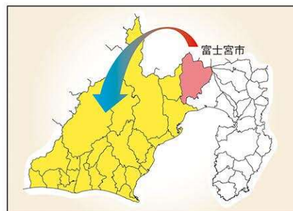
市外避難者の避難先

噴火の範囲が拡大し、市街地への影響が想定される場合、第4次A避難対象エリア、第4次B避難対象エリアも避難の対象となる可能性があります。その際、市内の避難先では収容が困難なため、右図のとおり県中部・西部地域への広域避難を行うこととなります。避難先、避難方法については、今後、県及び他市町と調整のうえ決定していく予定です。