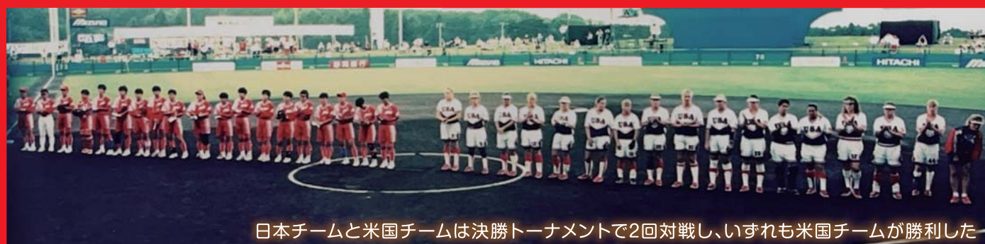
日本チームと米国チームは決勝トーナメントで2回対戦し、いずれも米国チームが勝利した