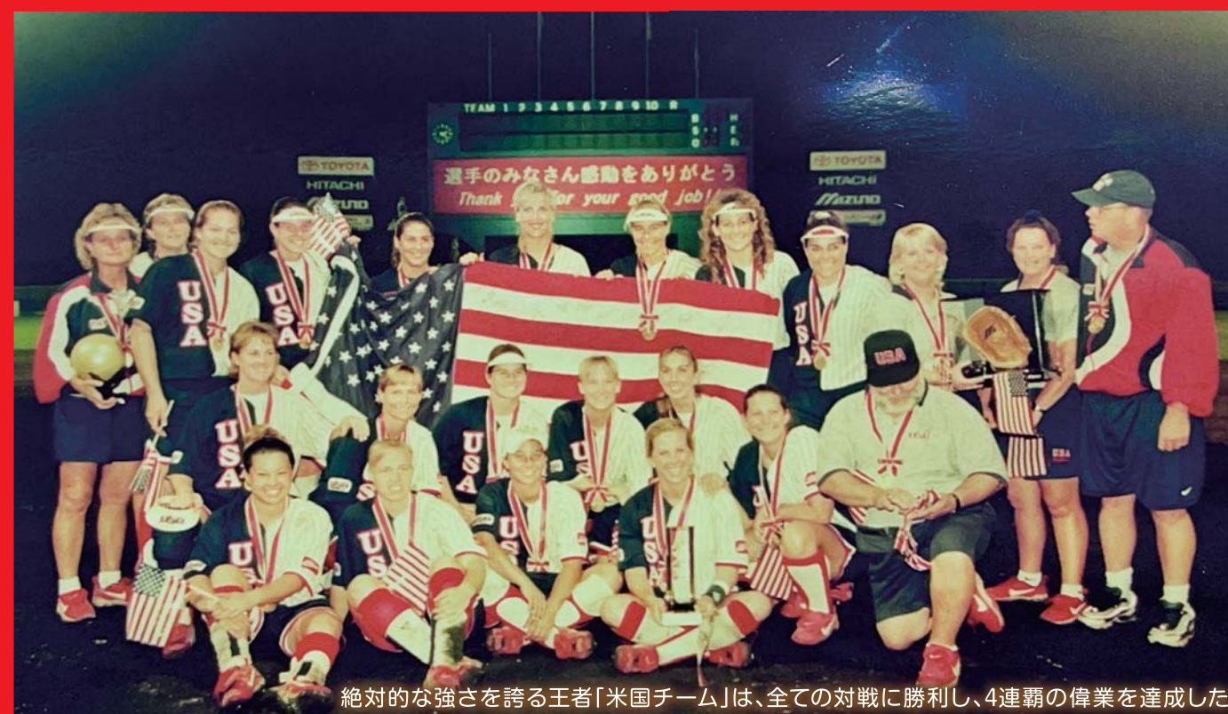
絶対的な強さを誇る王者「米国チーム」は、全ての対戦に勝利し、4連覇の偉業を達成した