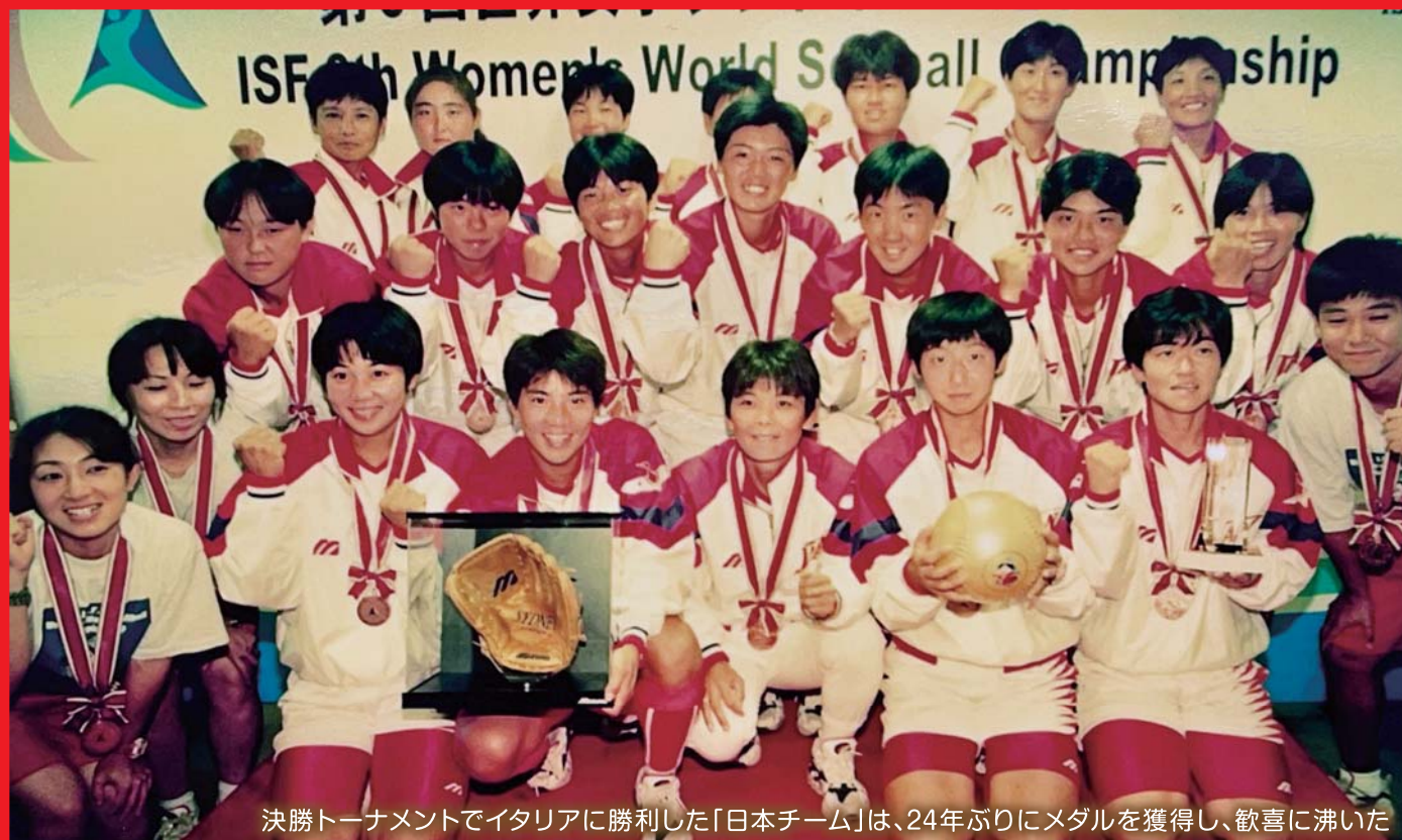
決勝トーナメントでイタリアに勝利した「日本チーム」は、24年ぶりにメダルを獲得し、歓喜に沸いた

激闘の結果、絶対王者として最有力だったアメリカが優勝し、2位オーストラリア、3位日本、4位中国、5位カナダがシドニーオリンピックへの出場権を獲得しました。